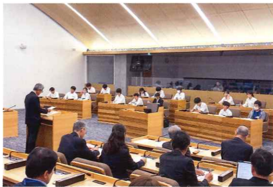
議会について生徒の皆さんから寄せられた質問に対し、議会報告会実行委員会の委員長がお答えしました。

人と繋がるあたたかい街について、若者がくつろげたり、地域の人と交流できる学習スペースやカフェがある街、商業施設を誘致して雇用を創出してほしい。安心安全な街については、交通網の充実、道路標識の整備、災害に備えた安心な街、LINEを使って市民に情報伝達、スクールバスの導入の意見が出されました。観光については、駅や駅前の再整備で活性化しにぎやかにすること。魚だけでなく、果物・野菜など自慢できること、歴史的建造物