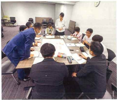
A班の意見交換の様子