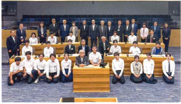
議会報告会の参加者の集合写真。今回の議会報告会は、市役所7階の議場及び委員会室で行われました。

当日は、焼津中央高校の生徒の皆さん及び中学生と大学生の皆さんの合計21名と議員が参加しました。