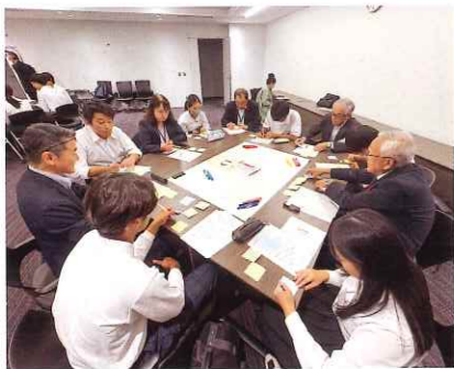
D班の意見交換の様子

商店街の活性化について、若者のニーズに合う店舗の誘致や閉店舗の貸借も考えられる。観光客の誘致について、インバウンド需要に応える古民家や街のストーリーが必要だ。食や祭りなどアピールし、観光客が住みたいような活動をしていきたい。