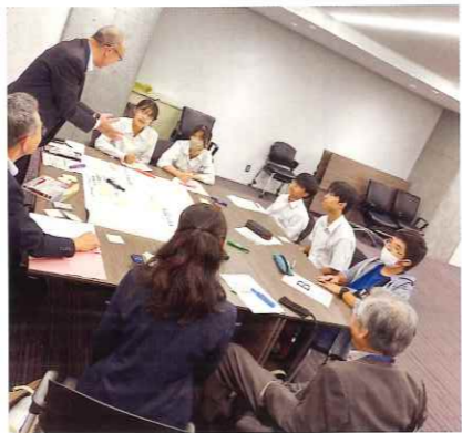
B班の意見交換の様子

防災訓練について、多様な状況を想定した訓練の実施、避難後の生活を見据えサイバルキャンプなど若い世代が参加できる実践的プログラムの導入、市の防災対策をSNSや学校連携など多様な手段で若い世代へ周知、水とトイレなどの備蓄を促す支援・啓発の強化、被災者への支援金・補償基準の見直しで小規模被害に対しても手厚い支援をする制度の充実について意見が出されました。