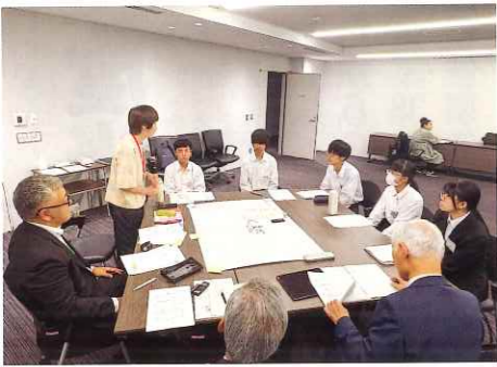
C班の意見交換の様子

文化について、参加する行動と気持ちが大変で、興味を持ってもらうイベントなどの場が多くあると良い、自分たち若者が企画運営・発信等をしてみたい。魚文化を伝えていくためには、体験型イベントの推進などトータ