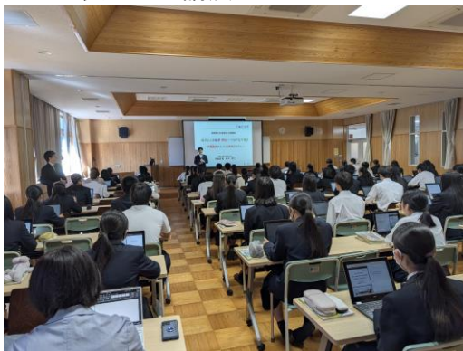
運営に参画する中学生と大学生