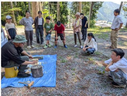
天龍村の小学生との交流イベント