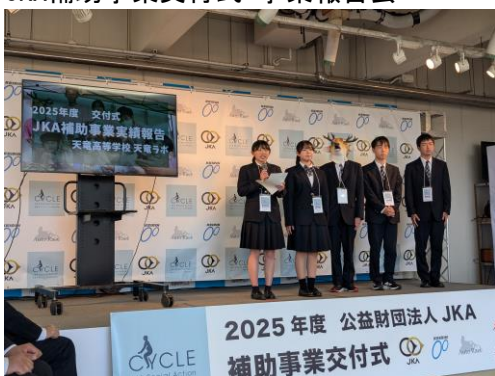
JKA補助事業交付式 事業報告会