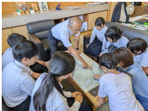
天龍村村長表敬訪問