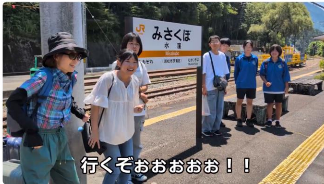
天竜ラボ 水窪・天龍村ツアー2025