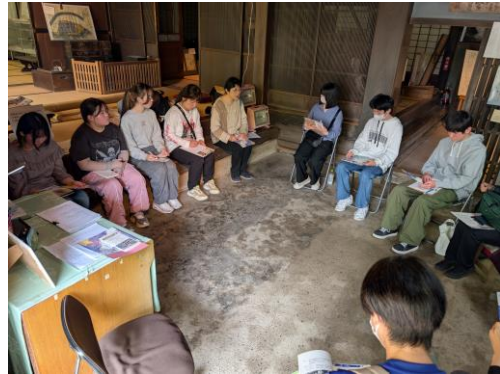
天竜おにぎり体験教室