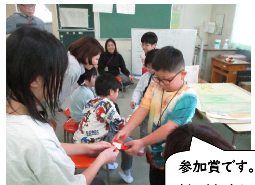
参加賞です。折り紙でサンタさんを作りました。