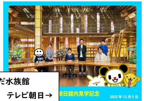
明日館内見学記念 2025年12月5日