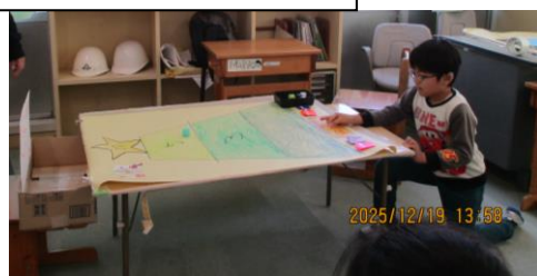
クリスマスカーリング