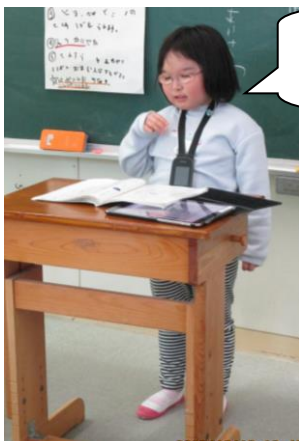
「日づけとよう日」の音読をしました。

12月19日に1年生が企画・運営した児童集会が行われました。学習の発表では、1年生が計算や音読を披露しました。ゲームは「クリスマスカーリング」を行いました。ペットボトルのキャップで作ったストーンを指ではじいて点を取るゲームです。強くはじくと「ドボン」になり0点になってしまうので、力加減を考えながらみんなで楽しく遊びました。