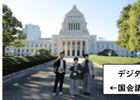
デジタルミュージアム→ ←国会議事堂