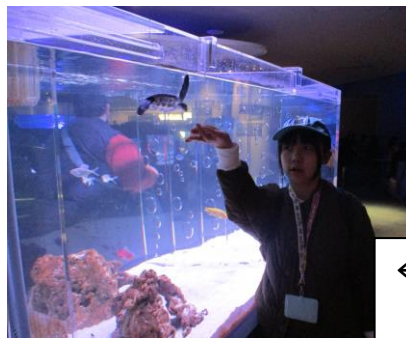
←すみだ水族館 テレビ朝日→