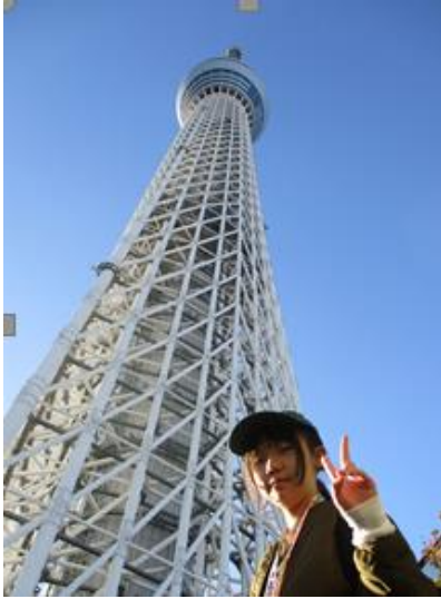
東京スカイツリー

今年の6年生の修学旅行は、浜松聴覚特別支援学校の女子1名と1日目の宿から合流をしました。(沼津聴覚は6年生がいません。)この日のために、5年生のときからZOOM交流をしてきたので「早く会って話したい。」と宿泊先に向かい、カードゲームをしたり、お土産を見せ合ったりして女子トークで盛り上がりました。