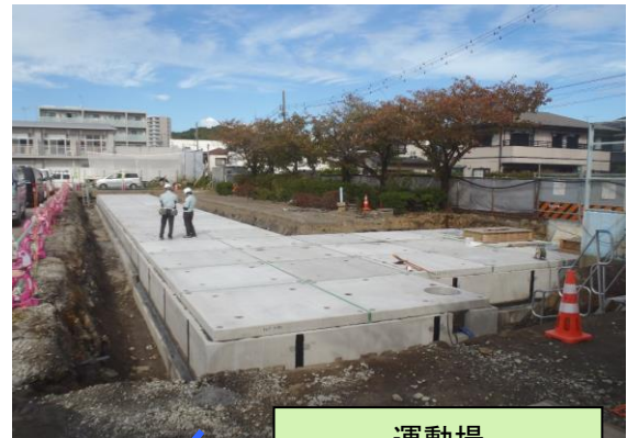
運動場 (雨水用地下貯留槽の設置)