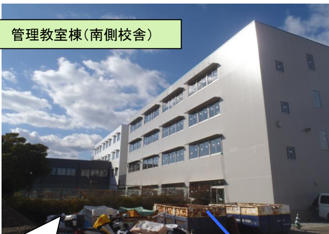
管理教室棟(南側校舎)