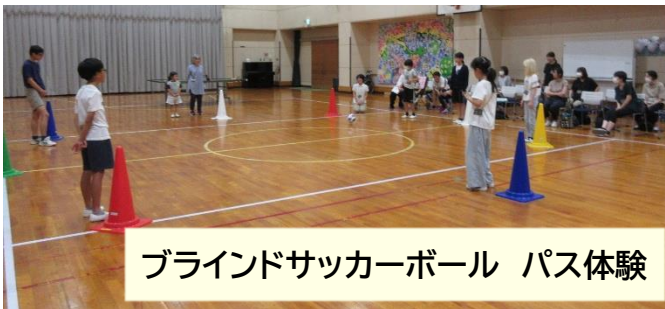
ブラインドサッカーボール パス体験

残念ながら、当日朝に発生したカムチャツカ半島付近の地震により津波警報が発表され、急遽1時間目の体育のみで終了とさせていただきます。次年度は、ぜひ新校舎で、他教科の活動や保護者座談会を通して交流が図れたらと思います。