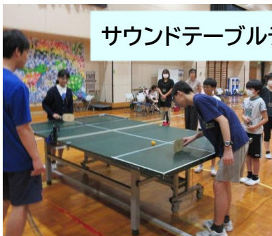
サウンドテーブルテニス

転がすと音が鳴るサッカーボールを使いました。蹴る前には、相手の名前を呼び合って「こっちだよ」「いくよ」と合図をしました。相手を思って受け取りやすく蹴ったり、ボールの音をよく聞いて受け止めたりすることができました。