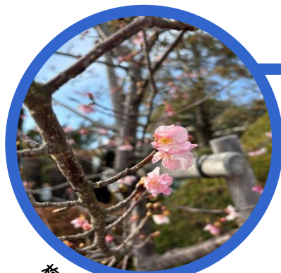
梅の花が咲きました♪

2月19日には、学校医の先生方やPTA役員の皆様にお集まりいただき、学校保健委員会を開催しました。保健室関係の報告とともに、新体力テストの結果や教育相談に関することを参加者で共有し、データをもとに静高生の健康課題について協議しました。生徒保健厚生委員探求班からは、「睡眠とストレス」をテーマに、アンケート調査による研究結果を報告しました。ここでは、令和7年度の学校保健関係のまとめをご紹介します。来年度の健康生活にお役立てください。