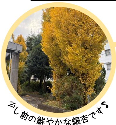
少し前の鮮やかな銀杏です

いった理由で保健室へ来てくれた人に、感染防止のため保健室の利用を遠慮するようお願いすることも多く、大変心苦しい日々でした。おかげさまで11月中には校内の感染状況は落ち着いて、2年生は全員で修学旅行へ出発することができました。生徒の皆さん、保護者の皆様のご理解ご協力に感謝申し上げます。引き続き感染症が心配な日々が続きますが、せっかくの冬休みです。充実した時間を過ごせるように、ぜひ体調管理をお心がけください。体調管理のポイントとして、今回は保健厚生委員から、「免疫力」に関する情報提供です。