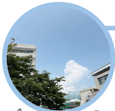
かき氷みみたいな入道雲が見えました

暑いだけでなんだか身体がだるくなります。夏休み中、それほど生活習慣が乱れてしまったわけではない人も、新学期が始まって、早起き、通学(遠くの人、本当にお疲れ様ですね)、授業、部活、下校、早く寝たくてもどうしても遅くなる…という生活になると、疲れが溜まります。「忙しい日々が始まるのか～」と想像するだけで気が重い人もいるかもしれません。新学期前後は特に、無理をし過ぎず、自分のところとからだの不調に敏感でいてくださいね。