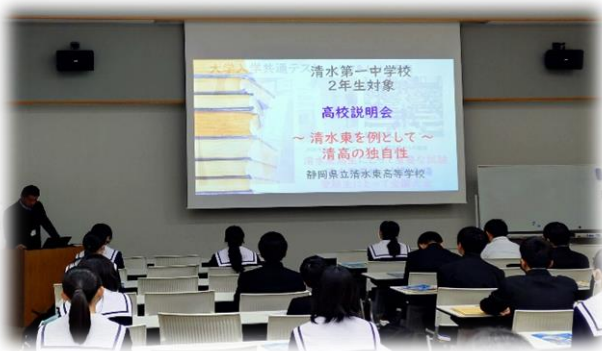
高校説明(視聴覚室 進路選択)

生物は、高校の教科書の内容にあわせて、体験的 作業が含まれるように、ヒトの眼の構造を扱いました。