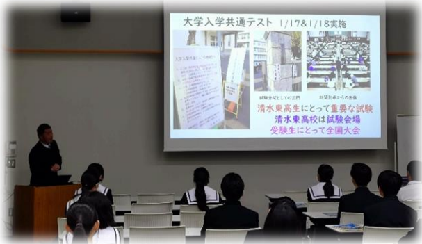
高校説明(視聴覚室 清水東を例に挙げて)

高校進学時の進路選択におけるポイントを、清水東高校を例に挙げて説明しました。 今回の授業体験や高校説明が進路選択の一助となれば幸いです。