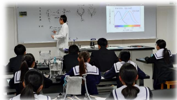
生物(生物室 授業体験の様子)

生物は、高校の教科書の内容にあわせて、体験的 作業が含まれるように、ヒトの眼の構造を扱いました。