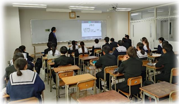
数学(授業体験の様子)

中学校で学習したグラフについて、 グラフ理論(大学学習内容)と関連付けた オリジナルの授業を体験しました。