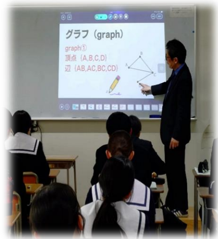
数学(グラフ理論の基礎)

中学校で学習したグラフについて、 グラフ理論(大学学習内容)と関連付けた オリジナルの授業を体験しました。