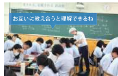
数学のグループワーク