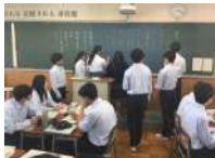
快適な学習環境 (普通教室全室エアコン完備)