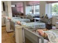
現場実習に対応した 介護実習室・浴実習室