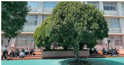
開放的で明るい中庭