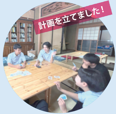
計画を立てました！