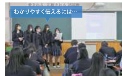
探究のプレゼンテーション