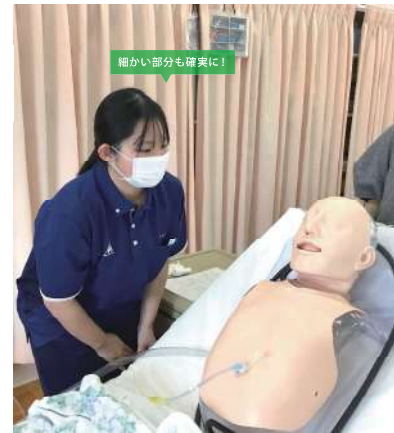
医療的ケアの実習