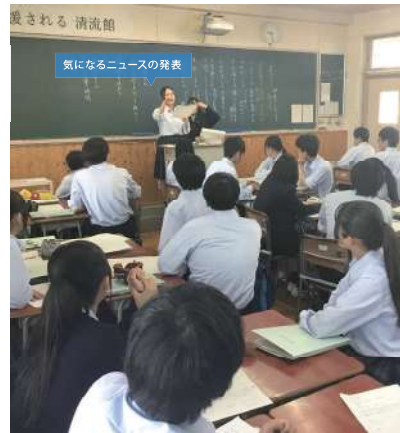
現代の国語の言語活動