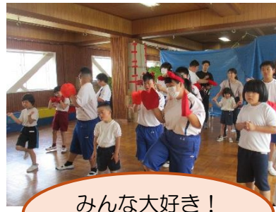
みんな大好き! エビカニクス