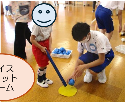
ナイス ショット ゲーム