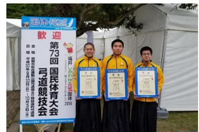
第 73 回 国民体育大会弓道競技