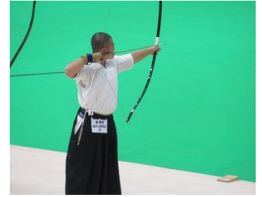
高校総体 個人出場