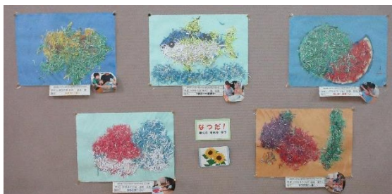
小学部2組:夏を作ろう(エコアート)

桜満開の始業式から76日が過ぎ、一学期が終了します。 廊下には夏本番を感じる図工美術作品が、美術館のように並んでいます。