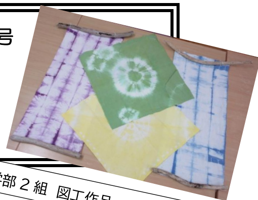
小学部2組 図工作品 つまんでそめよう

長引いた残暑もやっと落ち着き、秋らしくなってきました。 いよいよこれから、12月の学習発表会に向けての学習が始まります。