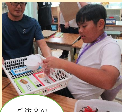
ご注文の品を準備