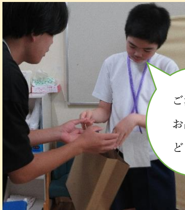
ご注文のお品ですどうぞ!