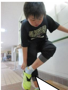
くつを自分で履けるようになったよ

4月に新しい仲間スタートした小学部2組。係の仕事や日常生活の中で取り組むことを決め、毎日責任を持って行いました。最初は、先生と一緒に取り組みながら行っていたのですが、少しずつ自ら行う姿が見られ、1学期後半には自信を持って行う姿がたくさん見られました。また、学校生活の中で毎日取り組むことで、できるようになったこともたくさんありました。できた時に、周りから称賛されて嬉しそうな顔をする様子も見られました。