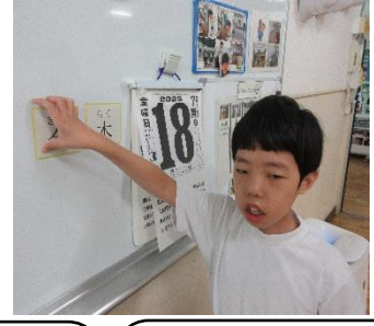
朝の会・帰りの会のプレートの間違えずに貼れたよ