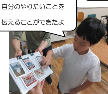
自分のやりたいことを伝えることができたよ