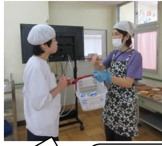
1組の牛乳を、毎日運んだよ