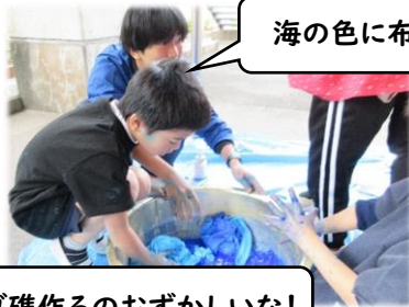
海の色に布を染めよう!

背景は、海の波をイメージして色水で布を揉んだり、回したりして、色鮮やかな青や水色に染めました。カクレクマノミの住処であるサンゴ礁を、教師と一緒に画用紙を丸めて形作りしました。ポスターと招待状は、ローラーを使ってカクレクマノミの縞模様を表現しました。