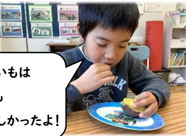
やきいもは とても おいしかったよ!

中学部のお誘いを受けて、グラウンドで焼き芋をしました。さつまいもに濡らしたペーパータオル、アルミホイルを巻き、焚火の中に芋を入れて焼きました。ホクホクのやきいもを食べで大満足の3人でした。