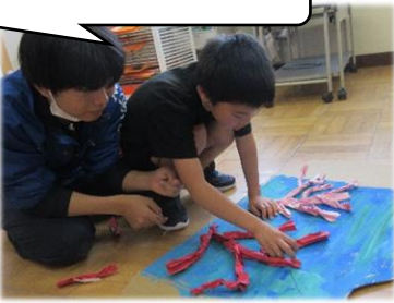
サンゴ礁作るのむずかしいな!