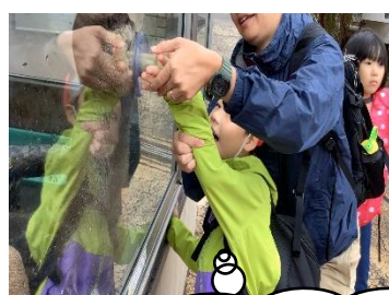
カワウソに 餌やり!

秋雨の中、歩いて下田海中水族館へ行ってきました。事前の学習でイルカになりきって真似をしていた高いジャンプや大技のボールタッチを、実際に間近で見ることができ、その迫力に子どもたちは大興奮! また、ペンギンの散歩にも立ち会い、ペンギンの後ろを楽しそうに真似して歩く児童の姿も見られました。授業の中でなりきっていた生き物を実際に見ることで、何を学んだのかがより深く結びつきました。さらに、ドキドキのカワウソの餌やりも体験でき、子どもたちは大満足の日となりました。