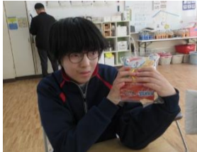
ラッピングもしました。楽しい会になりました。楽しい会になりそうです!