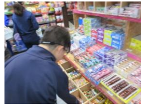
友達が喜びそうな物を考えて、商品を選びました。