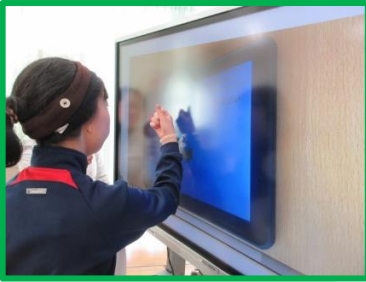
レストランのタッチキーの使い方を練習しました。