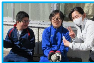
雪だるま作ったよ!