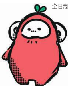
全日制マスコットキャラクター 「おひまる」