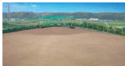
グラウンド・トラック