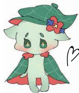
定時制マスコットキャラクター 「ひらり」