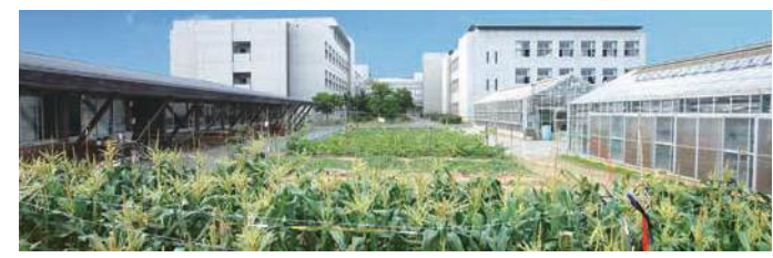
農業実習棟(左)と4つの温室(右)が、水田や農場を囲むように配置。

「実践的実習のための充実した施設」農業を学ぶための圃場や施設をはじめ、5室のパソコン室・福祉実習室・CAD製図室など、30室を超える実習室を持つ。最新の機材を揃え「必要とされる人材の育成」に取り組んでいます。 ※定時制：農業科目は履修できません。