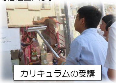
カリキュラムの受講

前回の実習での課題を克服するために具体的な目標を立て、学校生活の中でその目標を達成するために取り組んできました。今回の職場実習では、その成果を発揮することができました。