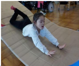
小 A12 年 『滑り台シューッ！』