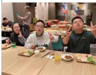
高 B3 年 『修学旅行』