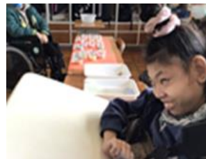
高 A123 年 『富士特マルシェ ～A 工房』