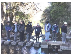
高 B2 年 『三島市のことを 調べよう』