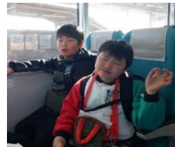
小 B4 年 『電車に 乗ったよ！』