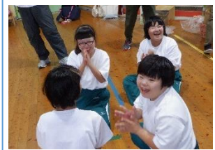
高 B1 年 『こどもの国 デイキャンプ』