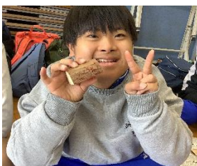
中 B2 年 『バードコール完成！』