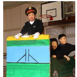
小 B5 年 『しゅっぱ～つ！』