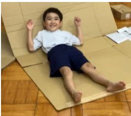
小 B2 年 『ダンボールで遊ぼう』