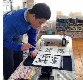
中 B3 年 『書初め～願いを込めて』