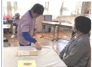
中 B1 年 『喫茶 B1～ありが とうを伝えよう～』