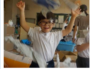
小 B1 年 『しんぶんし ヒラヒラ～♪』