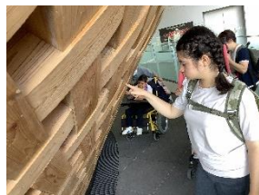
中 A12 年 『富士ひのきに 触ってみたよ』