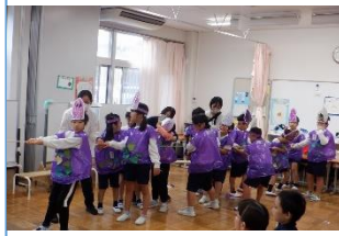
小 B3 年 『おはなしあそび』