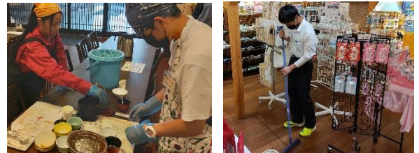
ワーク地域(万葉の湯様)での清掃作業