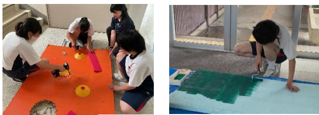
松濤祭、模擬店準備

私たち 3 年生は、明るくてにぎやかな学年です。3年1組のクラス目標は「頂点～助け合う、切り替える～」、3年2組のクラス目標は「つみき～経験を積み重ね、良いところを伸ばす～」です。また、3年生になり、時計を見て、次の授業が始まる前に準備をすることを頑張っています。今は、松濤祭に向けて模擬店の準備をしています。最上級生として学校を引っ張っていきます!