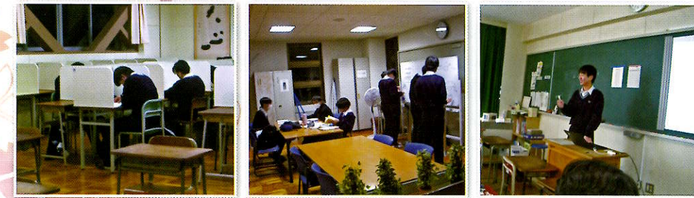
自習室(がんばルーム) 職員室前 進路研究発表会