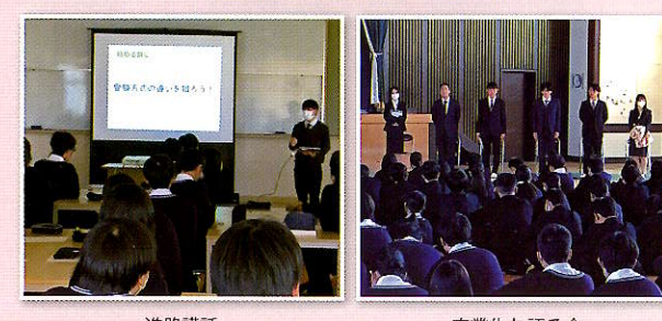
進路講話 卒業生と語る会