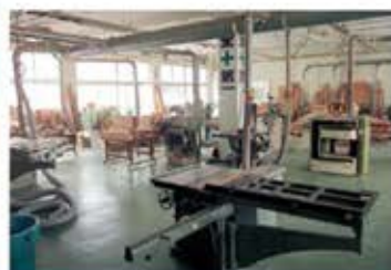
② 木材加工室 (第1実習棟1階)