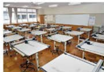
⑧ 製図室 (実習棟3階)