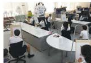
⑨デザイン室 (第1実習棟3階)