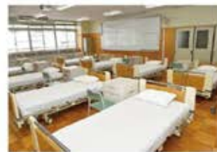
⑪介護実習室 (実習棟2階)