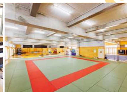
体育館 1階多目的室 2階アリーナ