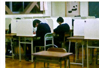
自習室 (がんばルーム)