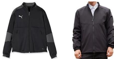
ウインドブレーカー