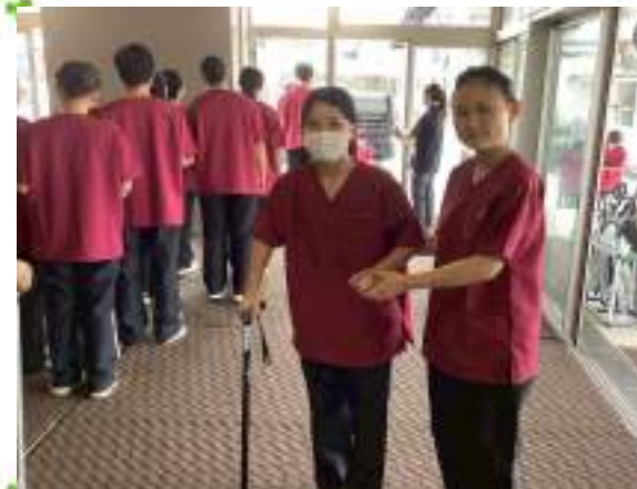
足が不自由な方の杖歩行介助