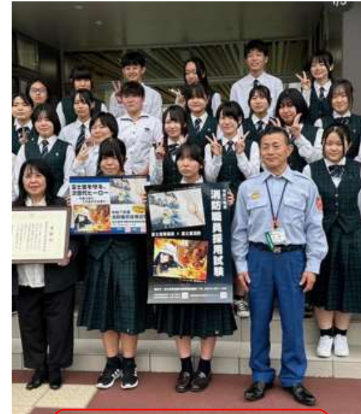
富士宮市消防本部 消防職員募集ポスター