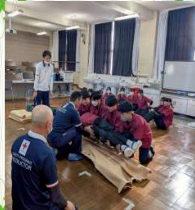
赤十字救急法救急養成講習

2年生では、医療ケアの介護技術や緊急時の対応など、より専門的な授業が始まります。