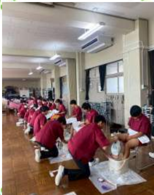
足浴でリラックス♪