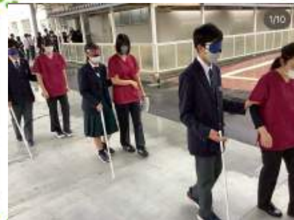
視覚障害者の移動の支援

1年生は実習を通して、福祉の基礎を学んでいきます。実際に体験することで、福祉を身近に感じながら理解を深めていきます。