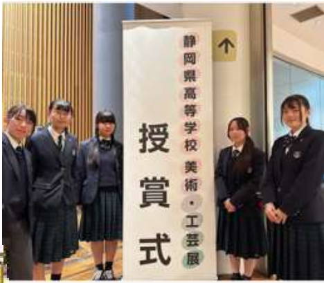
◎静岡県高等学校美術・工芸展 (東部展) 6名特選、28名入選