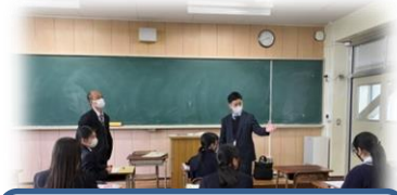
進路ガイダンス(1年生)