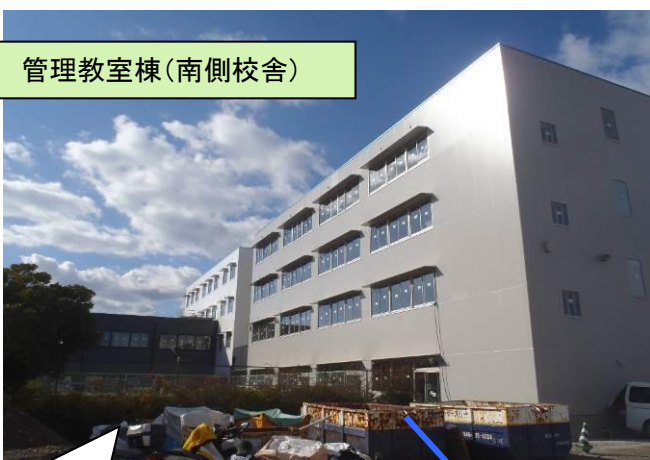
管理教室棟(南側校舎)