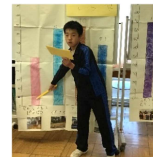
〔総合的な学習の時間〕

小学部で培った力を発揮し、存分に活動する充実感、人の役に立ったり仲間と協力したりする喜びを感じられるような学習に取り組んでいます。将来の社会生活を見据え、自ら気づき、選択し、主体的に行動する力の育成を目指しています。