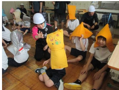
避難場所での様子