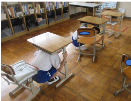
地震発生時の様子