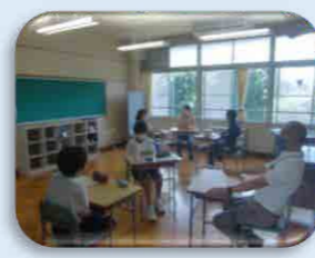
自立活動（ソーシャルスキルトレーニング）