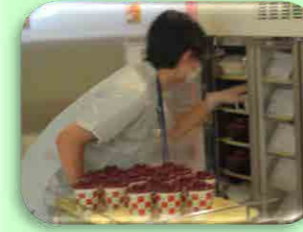
産業現場等における実習