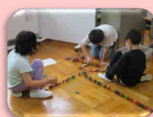
自立活動（ドミノ名人）