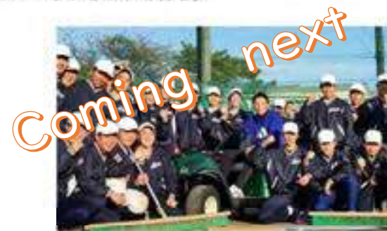
ヤマハ発動機様より寄贈されるゴルフカートを教材にグラウンド整備車を作ります！

本事業の成功体験を教職員に伝える必要がある。また、小さな成功例を集めてデータベース化して成果を共有・再利用すべきである。このこと教員の負担感を減らし、持続可能な取り組みにつながるはずである。