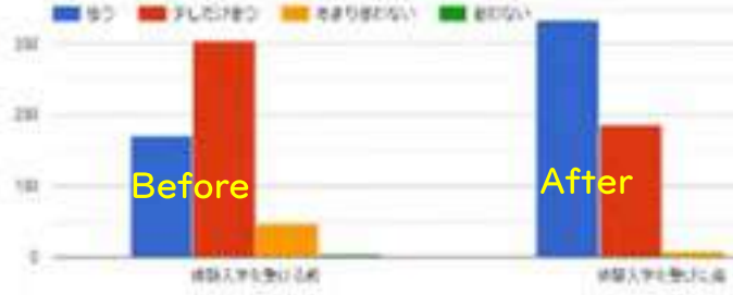
体験入学アンケート