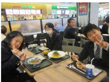
新静岡セノバのフードコートにてグループ毎のランチタイム。