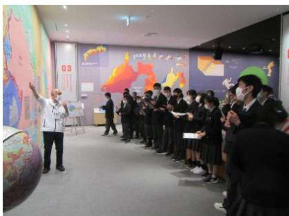
地震防災センターの職員から展示物の説明を受けました。

また、昼食は、グループごとに新静岡セノバやパルシェで、自身で選んで食事をしました。短い時間でしたが、友達との街でのランチは楽しい時間となりました。