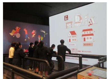
起震室にて映像を見ながら震度7までの揺れを体験。