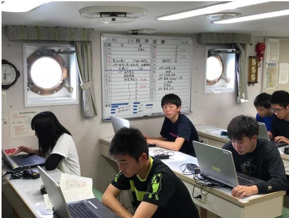
下船を目前に、感想文作成中！