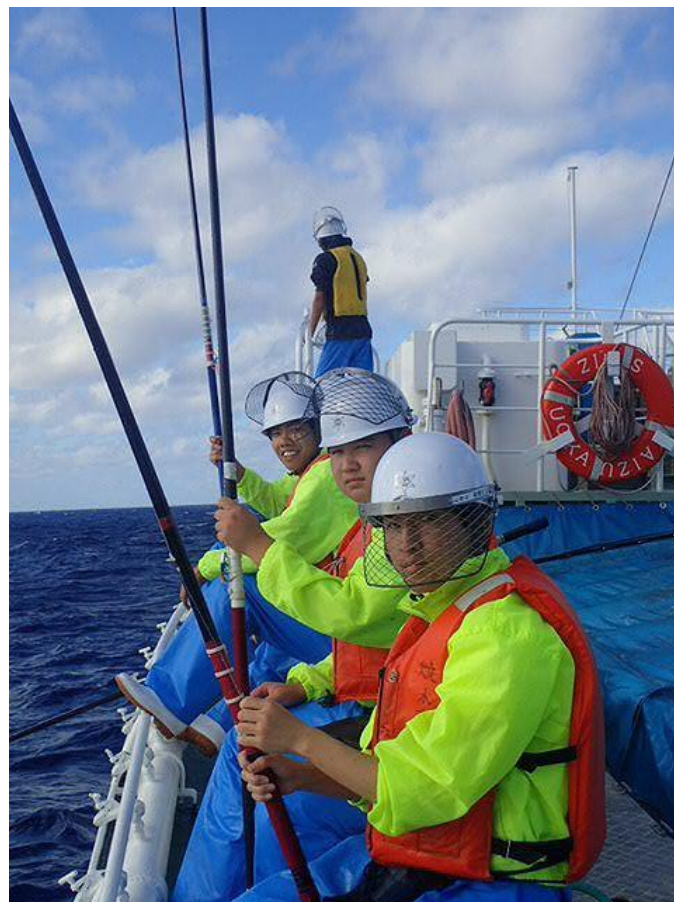
船の1番前（オモテ）で魚群を待つ専攻科生。準備万端、いつでも来い！！