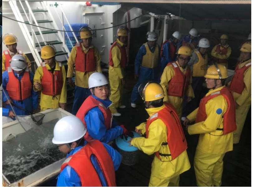
内浦にていよいよエサの積み込み