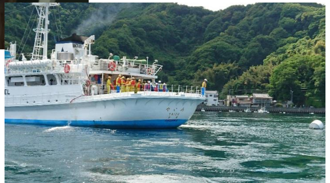
その後沖へ！→