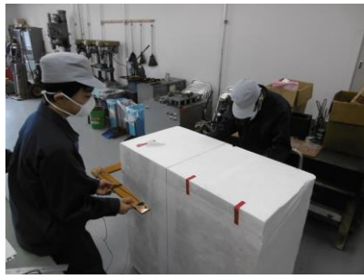
発泡スチロールの切断加工