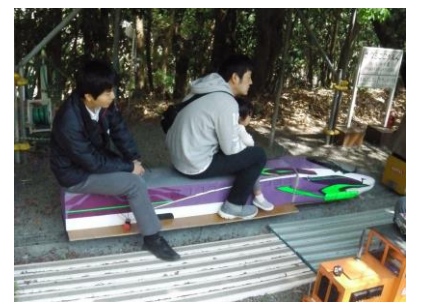
佐鳴湖公園でのイベント参加 （平成30年4月8日（日））