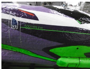
ステッカー貼り付け（レーザー加工品）