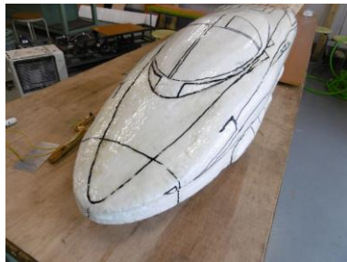
先端部分の曲線加工・下書き