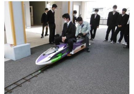
校内での試運転（6月に文化祭運転予定）