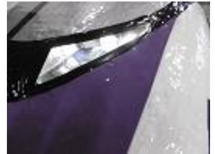
ライト点灯（LEDライト使用）