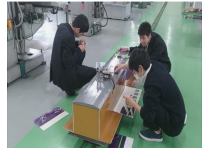
サイドプレートの取付け