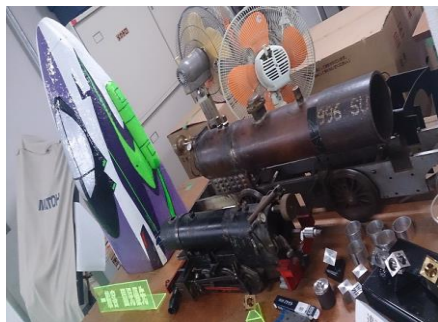
先端部分の完成品とミニS L（製作中）