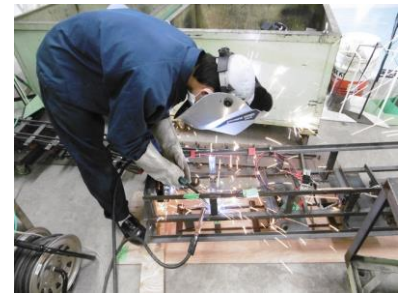
ベースフレーム加工・溶接