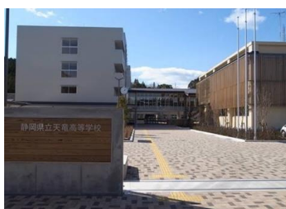
県立天竜高校の外観