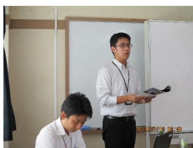
倉橋学園 キラリ高等学校の先生

高等学校の先生方をお迎えして、学校の特徴や、学習内容、学校生活の様子についてお話を伺いました。今回お招きしたのは、私立通信制高等学校、公立定時制高等学校、公立全日制高等学校の3つの種類の高校です。授業内容や通学スタイルが様々であることがパンフレットやスライドを使って紹介され、各校の説明時間の25分間はあっという間に過ぎていきました。最後に、「自分に合っているかどうかを考えることが大事」というメッセージをいただきました。生徒の皆さんのそれぞれの進路選択に役立ててもらいたいと思います。