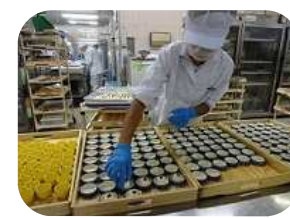
産業現場等における実習