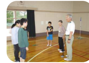
下阿多古青葉会との地域交流