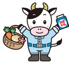
田農マスコットキャラクター でんも〜