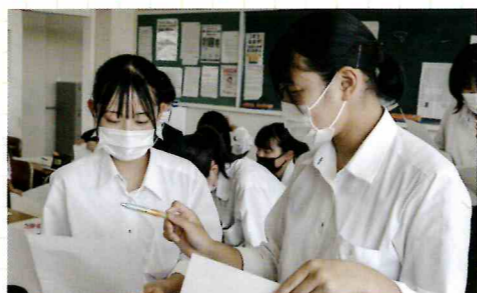
課題探究、実習、検定挑戦