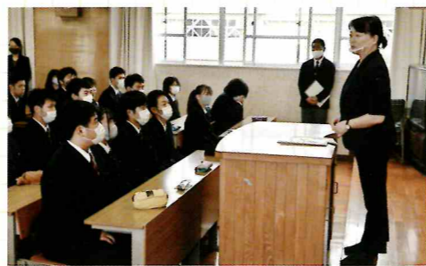
面接練習、履歴書添削