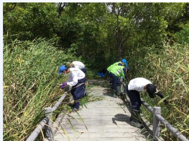
「せいっぱい がんばっています」