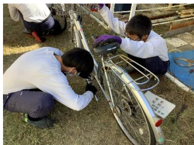
廃棄自転車解体作業