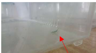
バッタの赤ちゃん