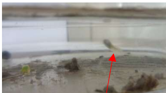
メダカの赤ちゃん