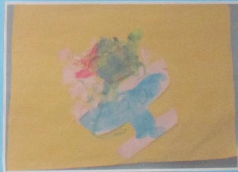
おおきな かきごおり