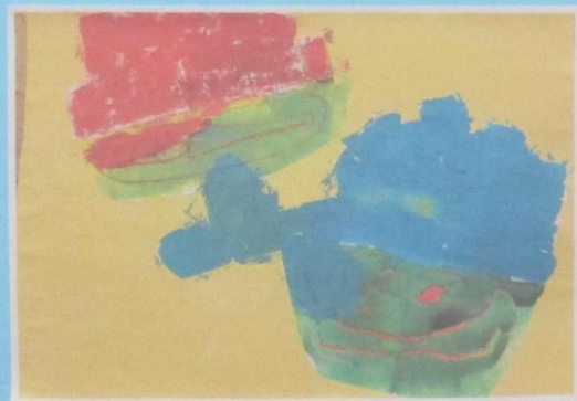
げんき もりもり かきごおり