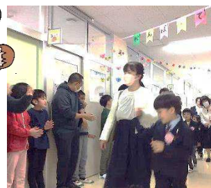
↑会場までは、おめでとうの花道