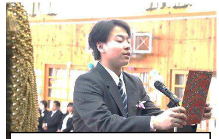
入学式・新入生代表の言葉

新一年生 34 名が入学し、103 名の生徒と 35 名の教職員の 138 名で新たな生活がスタートしました。高等部スローガンの「103+35」には、「103 名の生徒を 35 名の教職員で支援する」という思いが込められています。この高等部スローガンについては、生徒たちにも学部集会で伝えています。