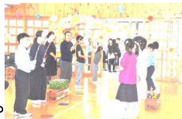
↑5.6年生による入場アーチ