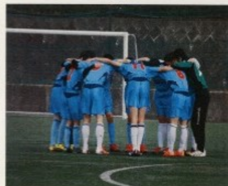
部活動 リッカー部の様子

現場実習では、働くことの喜びや厳しさを体験し、将来社会人として生きる力を身につけようとしています。御協力よろしくお願い致します。