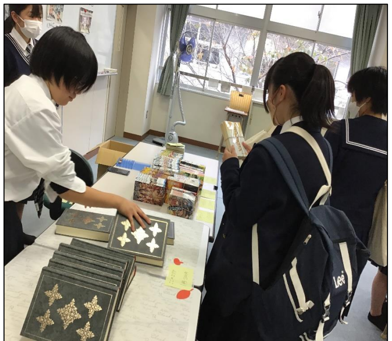
（写真は昨年度オープンスクールでの古本市の様子）

提供する側にとっては断捨離に、買う側にとっては新たな本との出会いに、売り上げは能登半島地震への募金になり、三方全て良し！の企画です。小説だけではなく、マンガやレシピ本、絵本や写真集、シリーズ物の途中巻だけなど、どんな本でも構いません。御協力していただける方は、 5月29日（水）まで に、 2階渡り廊下の提出箱 に入れて下さい。ぜひ御協力をお願いします！